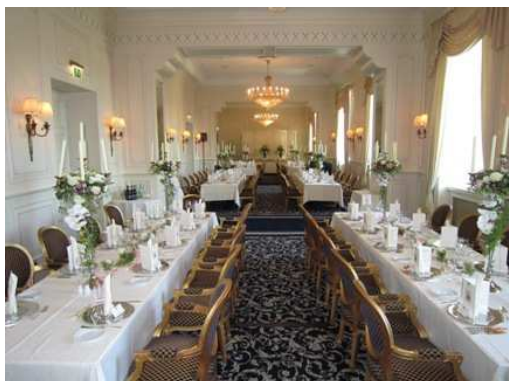
mehrere Tafeln bis zu 80 Personen