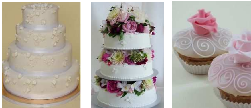
Tortenkollektion der Patisserie Madame Miammiam

Unsere hauseigene Patisserie zaubert Ihnen Ihre ganz persönliche Torte. Der Preis richtet sich nach dem Aufwand, bitte kalkulieren Sie ca. 10,00 EUR pro Person.